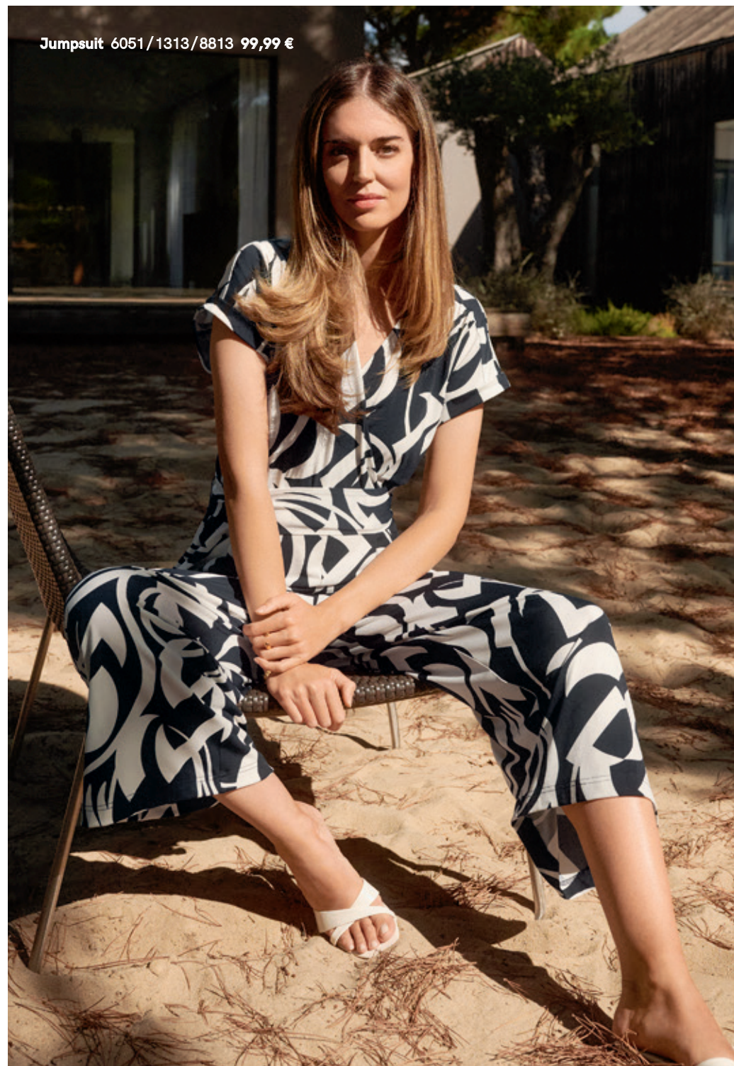
Jumpsuit 6051/1313/8813 99,99 €