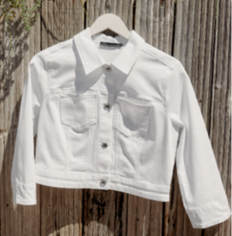
Jeansjacked 4370/2208/1620 99,99 €