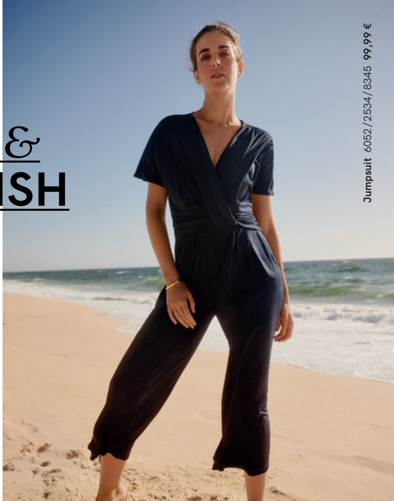
Jumpsuit 6052/2534/8345 99,99 €