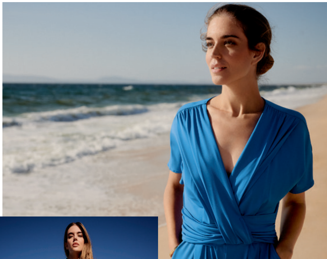
Jumpsuit 6052/2534/8126 99,99 €