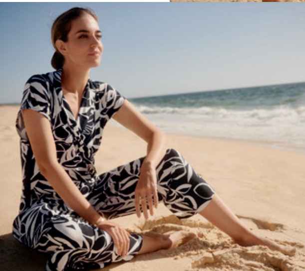
Jumpsuit 6058/1312/8813 119,99 €